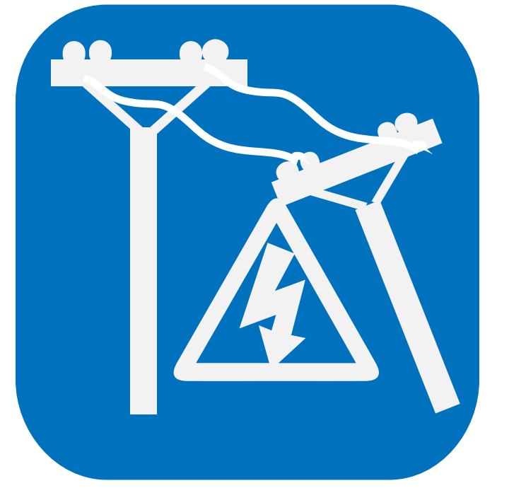
有時伴隨下雪和洪水